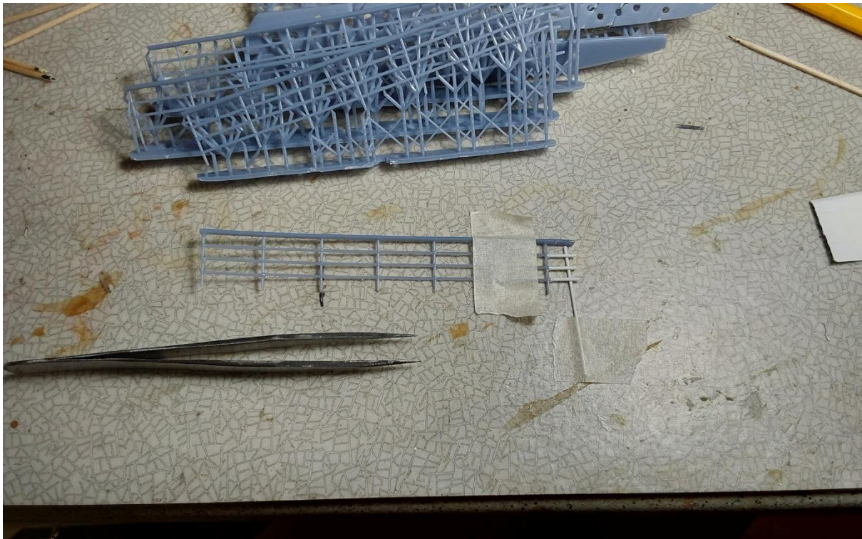
Reelinkien osakokonaisuuksia tukirakenteineen. Erittäin helposti katkeilevia osia korjailtu ohuesta 0,7 mm styreenitangosta leikatuilla pätkillä.

Muutamastoihin tulevat tikkaat olivat niin pahoin vääntyneet, että niitä ei oikein voinut käyttää. Tällöin ei jäänyt muuta keinoa kuin tehdä jigi pienestä vanerinpalasesta ja liimata siinä uudet tikkaat 0,7 mm styreenitangosta.