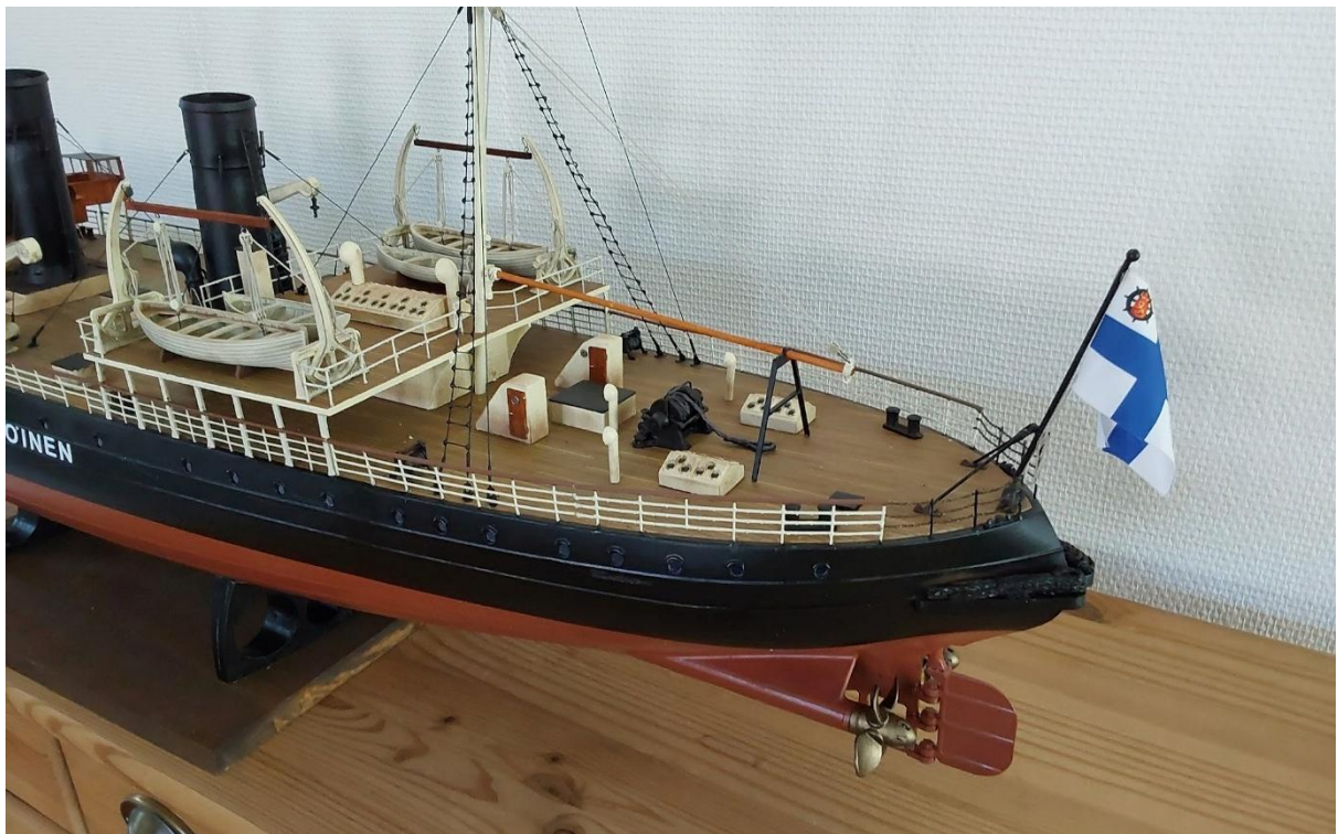
Teksti ja kuvat: Matti Piilola